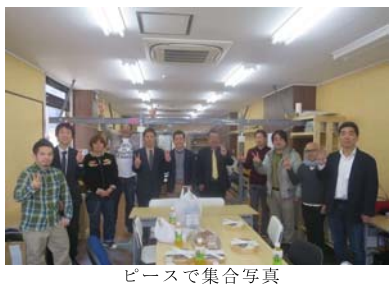
ピースで集合写真