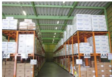
物流センター(静岡県清水市)

1984年設立、世界45か国以上で年間10億枚以上を製造する大手ボディメーカー。バルバドスにセールス&マーケティングがあり、ロンドン、上海、NY、東京にセールスオフィスを構える。従業員数は全世界で4万7千人を超える。