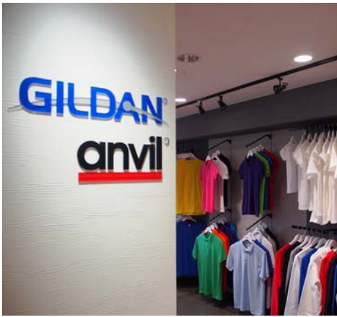
GILDAN, Anvil, COMFORT COLORSブランドの商品が常時展示されているショールーム(東京都渋谷区)は、事前の連絡でいつでも見学が可能。発注システムについて実際の画面操作でデモを見ることが出来ます。