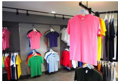
J R原宿駅徒歩8分のショールーム

ア市場のシェア獲得でした。今後はさらなるラインナップの充実と業界への認知訴求を目指し、加工業務は行なわず、ボディ販売を通じてプリント事業者との関係作りに注力していく予定です。またJOTA賛助会員としても「今後は協会メンバーと情報交換を活発におこなっていききたい。」とコメントがありました。