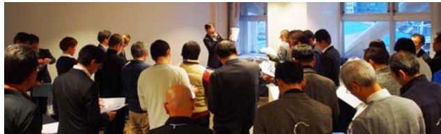
賛助会員によるプレゼンテーション

ていくことと、常日頃私たちが支えてくれている「お客様に対する価値向上」、そして最後に「社会貢献」を行なうこと。これは物資であったり私たちが汗をかきことであつたり、いろいろな方法があります。この協会の3つの理念に共感していただいている皆様と、これから一緒に歩んでいきたいと思ひます。