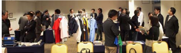
フリータイムでの商談風景

開催の10日が東京ビッグサイトで最終日となる展示会、インターナショナルギフトショーと重なり、スケジュールの調整が難しいなか、多くの賛助会員が正会員へ熱のこもったプレゼンを行いました。次回も総会に参加する会員にとつて、意義あるイベントとなるよう企画していきますので、提案事項などございましたら事務局までご連絡ください。展示プレゼン参加会員のみならず、お疲れ様でした。