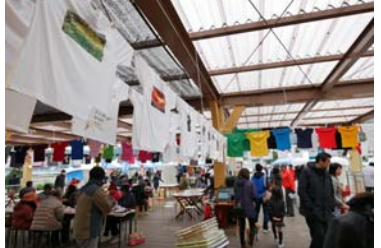
前は雨のため管理棟内に展示

オリジナルTフェスティバルの森理事は「今回は体験、イベントともに有料で開催する。無料の時とは違い、相応のサービスを提供する必要があります。補助金、協賛