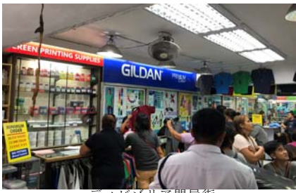
ディヤルバクル問屋街