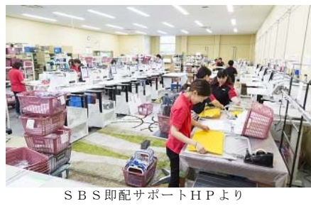
SBS即配サポートHPより

12月7日(金)、今年最後の工場見学会を開催します。見学会は栃木県日光市にあるSBS即配サポート(株)栃本市センターです。ラインストーン・刺しゅう・スパンネル加工などのアパレル加工を行っています。JOTA非会員事業者ではあります。連性の高い事業内容になりますので、ぜひご参加ください。工場見学会後は、近くのニューサンピア栃木で今年の見学会開催となる忘年会を開催いたします。