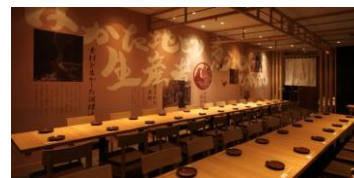
交流会会場

今年で3回目となる、森会長主催の夏の交流会。今回は日程を9月に変更して、OGBS東京の1日目に設定、池袋の居酒屋を予約しました。最大60名収容ということで、今年の会場よりは広い（はず）です。OGBSに行ったあと、池袋で夏の商戦を振り返りつつ、楽しいお酒を飲みましょう！